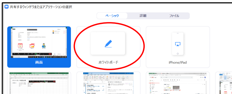
②「ホワイトボード」を選択