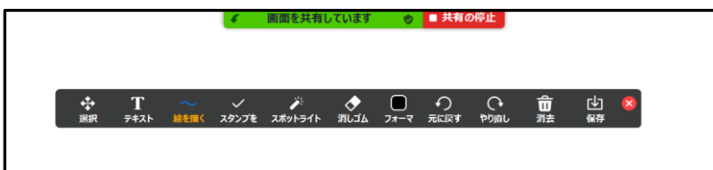
↑ 真っ白な画面にツールメニューが表示される